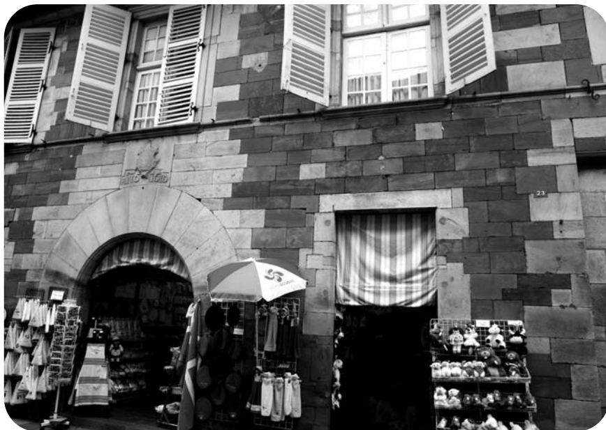
Une mémoire oubliée : les États de Navarre à Saint-Jean-Pied-de-Port

de 1792. C'est la France, referendum de chaque jour, la France définie comme le vouloir vivre ensemble. C'est Renan contre Mommsen. Face au nationalisme allemand définie par la culture allemande, les nationalistes français affirment que la France est un vouloir vivre ensemble, au delà des langues. Mais en même temps, les dirigeants français, surtout à gauche d'ailleurs, veulent éradiquer la diversité culturelle présente sur le territoire étatique. C'est Barrère le Conventionnel jacobin, voulant « supprimer ces instruments d'ignorance et d'erreurs » que sont les langues régionales ; ce sont les républicains de la III ème république et leurs instituteurs qui veulent étouffer les cultures régionales rebaptisées « patois » pour mieux les mépriser. Le plus pervers, est que ces braves gens étaient sincèrement persuadés que la langue française était supérieure aux « sabirs » ruraux, qu'oublier sa langue maternelle au profit du français était un signe d'élévation culturelle.