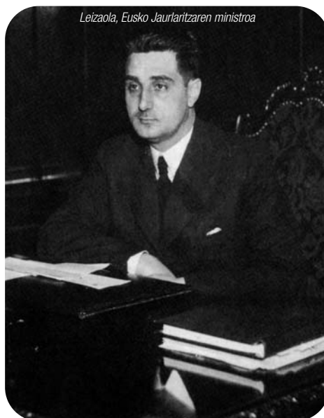
Leizaola, Eusko Jauriaritzaren ministroa

Ez zen bakarrik sindikalgitzan arizan. 1922an muntatu zuen manifestazio bat Gernikan, Euskal Unibersitate baten alde. Guardia Zibilak arrestatu eta errepidez, oinez, eraman zuen Bilboraino. Unibersitatearen aldeko manifa hori oso famatua bilakatu zen abertzalegoaren historian. Prentsan ere idazten zuen Foruen alde eta polemika batzu ere ukan zituen kontrakoekin. « Euzkadi » egunero agertzen zen kasetaren kontseiluan sartu zen.