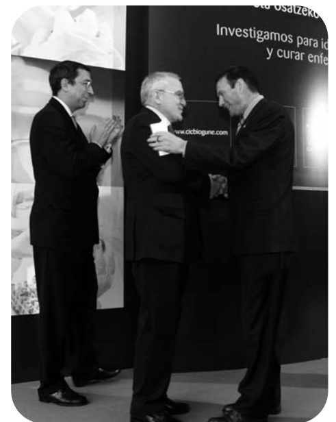
Ibarretxe promeut l'innovation

L'économie basque semblait connaître un avenir meilleur qu'actuellement, grâce à l'effort et le sacrifice de tous comme cela a été mis en évidence le 12 Juin 2008, lorsque le Gouvernement d'Ibarretxe et les trois Diputacions forales ont signé un accord institutionnel pour faire face à la récession, celui que niait le Gouvernement de Zapatero, grâce à un investissement supérieur à 12 milliards d'euros sur plusieurs années.