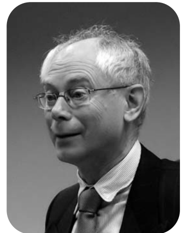
Herman Van Rompuy

Par ailleurs, la désignation de Mme ASHTON permet de nommer une femme à l'un des quatre postes stratégiques de l'Union. Et les quatre coins de l'Europe seront ainsi représentés : le