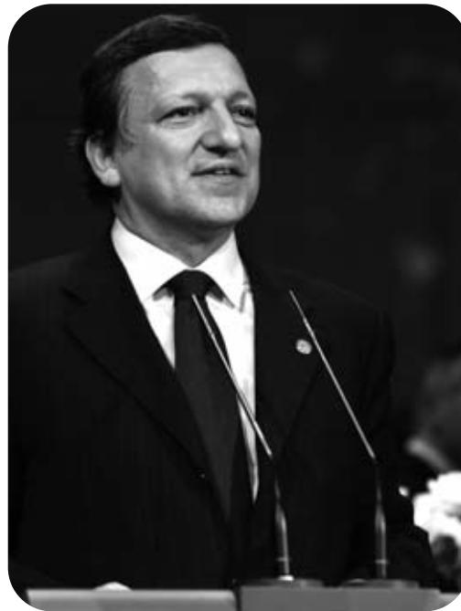
Jose Manuel Barroso, président de la Commission européenne

Le temps est peut-être venu de se remobiliser sur le renouveau du projet européen ; un débat sur l'identité de l'Europe ne pourrait-il pas venir remplacer utilement le débat actuel sur l'identité nationale ?