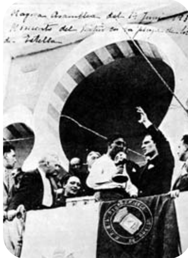
Lizarrako mitina : 1931/06/14

apartekoa izan da Euskal Historian .Nafarroa eta Euskadiren arteko topaketa lau menderen buruan berriz gertatu baita .Hau izan da Hego Euskal herriko lurraldea batzeko emaniko urratsik ausartena »