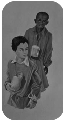
La couverture du livre

Cette situation induit une perte du sens de la transcendance et des plus hautes valeurs issues de la raison et de la tradition occidentale. La France a perdu le sens d'elle-même, ce qui est à la source du sentiment prégnant de désaffiliation sociale que l'on rencontre partout.