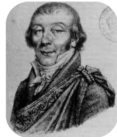
Dominique Joseph Garat, défend le Labourd durant la période révolutionnaire

La Révolution, en moins de 10 ans, est passée par des étapes en rien exemplaires. La Convention a enfanté le Règne de la Terreur (et ses 40.000 morts, selon les paroles de Robespierre : « la Terreur n'est rien d'autre que la justice rapide, sévère, inflexible ») et ses répressions génocidaires, telles la Vendée, qui commence à être reconnue ces dernières décennies comme « le premier génocide de l'Histoire contemporaine ». Là, les Jacobins ont mis en pratique ce qui peut être décrit comme une tentative générale de « Solution Finale » : en 18 mois, sur un territoire de seulement 10.000 kilomètres carrés, 120.000 personnes ont disparu, au moins 15% de la population totale de la région ce qui reviendrait à tuer à l'heure actuelle 10 millions de personnes en France.