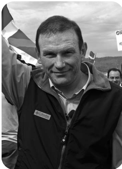
Juan Jose Ibarretxe fut l'un des chefs de gouvernements les plus charismatiques d'Euskadi