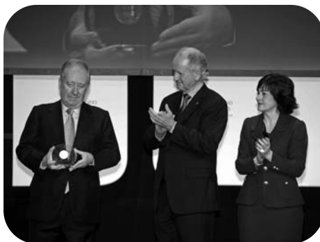
La CAF, une réussite basque impressionnante

L'Université privée de Deusto fut créée en 1886 par la Compagnie de Jésus. Elle a toujours eu une grande renommée. Elle a fortement contribué au développement industriel et économique du Pays Basque sud. Elle est au service de la société et œuvre pour l'excellence académique et la recherche de la qualité. C'est la première université européenne ayant appliqué le système des crédits ECTS à tous les cursus de formation.