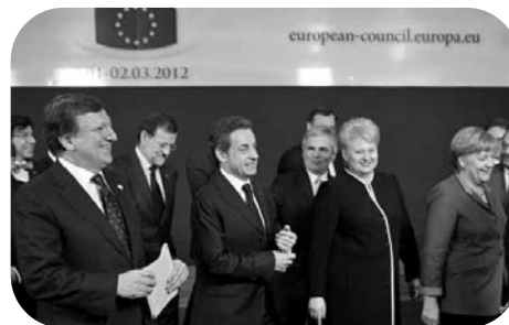
Une entente difficile entre dirigeants européens

Les discussions autour de ce texte ont montré aussi que les États-membres avaient encore du mal à trouver des solutions communes pour relancer la croissance ; les désaccords restent profonds entre ceux qui estiment que le salut viendra d'une accélération des libéralisations (dont la Grande-Bretagne ou l'Italie...) et ceux qui voudraient une politique économique plus interventionniste (à l'image par exemple de la France...).