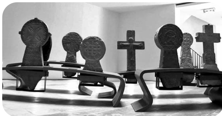
Nous connaître grâce à un patrimoine et une mémoire locale divulgués