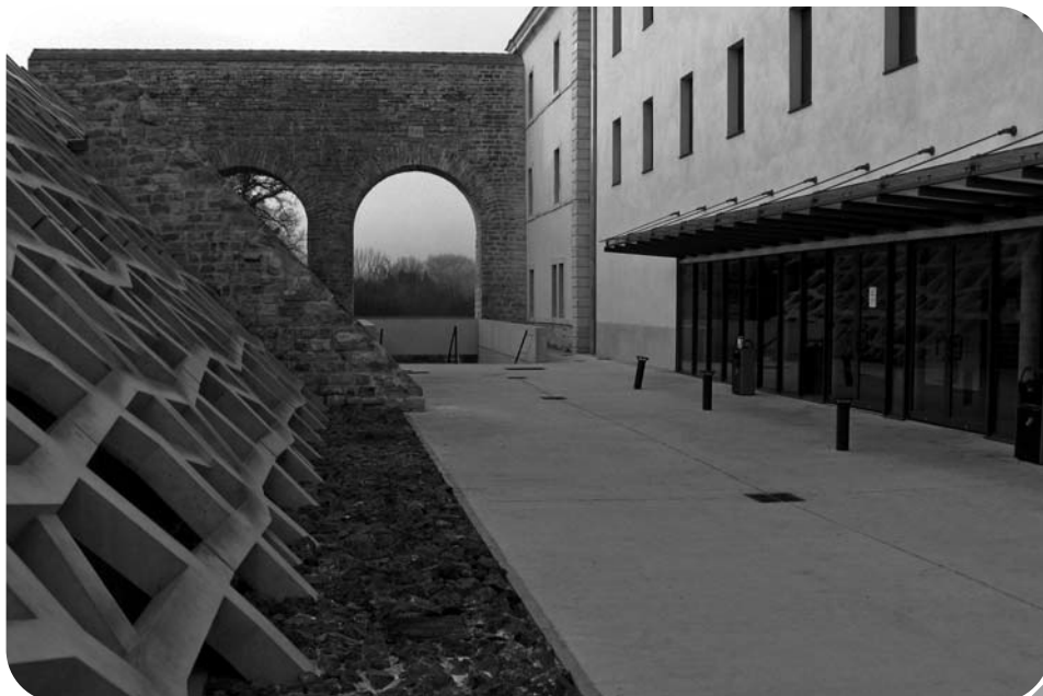
Une université limitée par une absence de pouvoir local