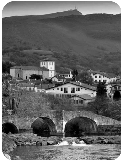
Un atout : notre qualité de vie

l'occurrence, il s'agit des trois options qui avaient été déjà envisagées lors de la rencontre entre le dispositif CEPB/CDPB et M. Balladur le 17 février 2009 : le maintien du statut actuel, la constitution d'un établissement public et la création d'une collectivité territoriale à statut particulier dotée de compétences propres.