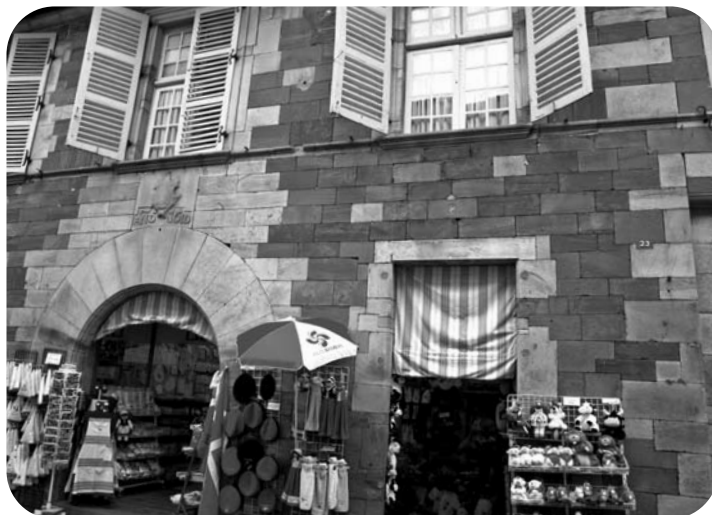
Un renouveau Bas-Navarrais ? Le bâtiment des Etats de Navarre à St Jean Pied de Port

Toutefois, les représentants de l'Etat ne sont pas hostiles à la réflexion engagée. Leur position a évolué sur cette question et si, au départ, il ne s'agissait pas d'un point de leur ordre du jour, ils sont désormais prêts à accompagner la démarche.