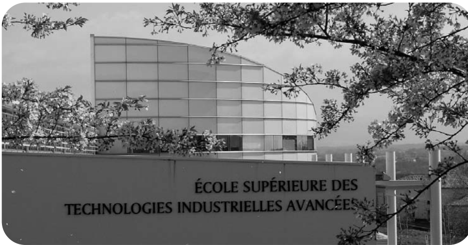
L'Estia, une école au service du développement local

Le Conseil de Direction du Conseil de Développement, le 19 septembre 2011, a adopté une méthodologie qui s'articulait autour de deux phases : la première consistait à déterminer les domaines d'action qui pouvaient être assumés à l'échelle Pays Basque et à quel niveau. La seconde phase reposait sur l'examen minutieux des structures juridiques que pouvaient adopter le Pays Basque. En