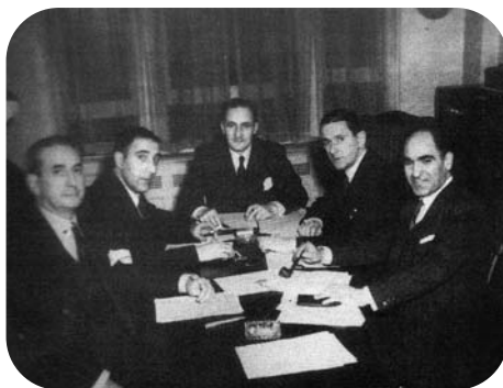
Réunion du Gouvernement Basque. New-York 1945