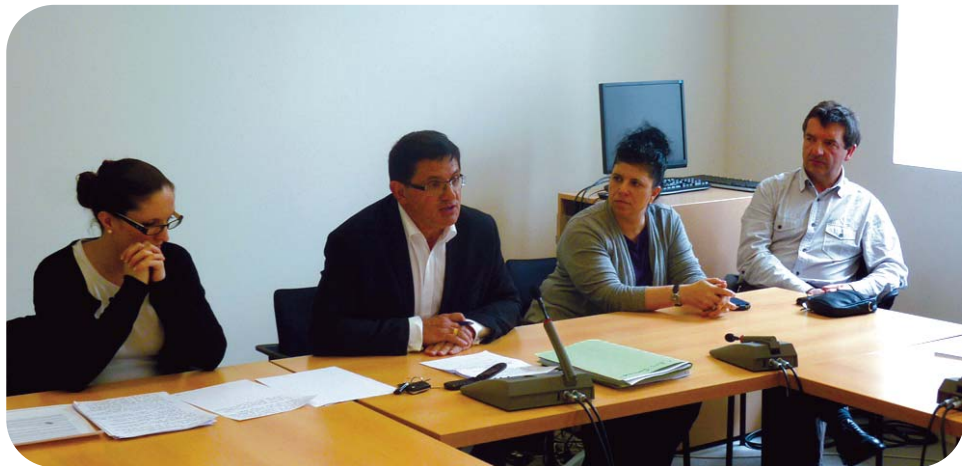
Le bureau du Conseil de Développement rend public l'avis

Il invite le Conseil des élus à se saisir de ses préconisations dans les meilleurs délais pour élaborer une proposition commune sur ce que pourrait recouvrir une collectivité territoriale – les domaines d'actions, les compétences, l'articulation avec les autres collectivités, les moyens (et notamment, la fiscalité), ainsi que la complémentarité entre cette institution et le Conseil de développement.