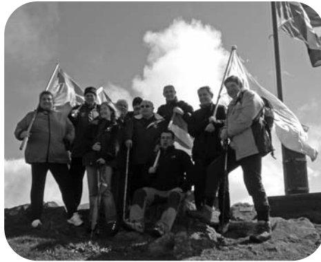
Des responsables d'Udalbiltza au sommet d'une montagne

Udalbiltza est une organisation d'essence municipale, l'organisation la plus proche des citoyens, à savoir le niveau le plus approprié pour faire la paix entre nous. Nous devons avoir présent à l'esprit deux conditions : d'une part un engagement éthique solide, et d'autre part un engagement politique démocratique.