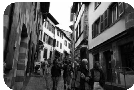
Les commerçants s'organisent