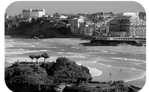
Le tourisme et l'immobilier au cœur de l'économie résidentielle