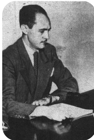
Jesús de Galíndez

« El derecho vasco » en 1948), multiples conférences aux États-Unis mais aussi dans toute l'Amérique Latine ; il noue des rapports avec beaucoup d'intellectuels et préside un temps le Cercle des Ecrivains et Poètes Latino-américains de New-York ; il est professeur de Droit Public Hispano-américain et d'Histoire de la Civilisation Latino-américaine à la prestigieuse Université de Columbia.