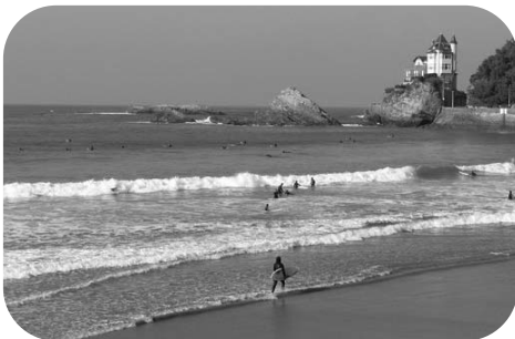
Un littoral attractif

quant au Pays Basque intérieur, il présente des caractéristiques de territoires enclavés où la population tend à diminuer avec le recul des activités agricoles et la disparition des activités industrielles traditionnelles (ce phénomène est particulièrement marqué en Soule qui bénéficie du reste d'un dispositif particulier d'accompagnement et de reconversion).