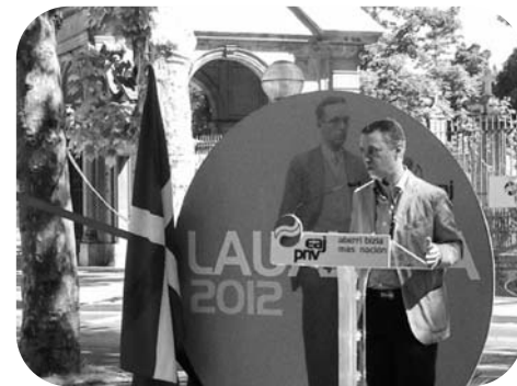
Iñigo Urkullu Lauaxetaren omenaldian

Urkulluren aburuz, “bakearen ongi gorena geureganatu dugu ; eta gure eskuan dago balore iraunkor eta finko bilakatzea, ongi horren oinarrian, bizikidetzeta berria eraiki dezagun”.