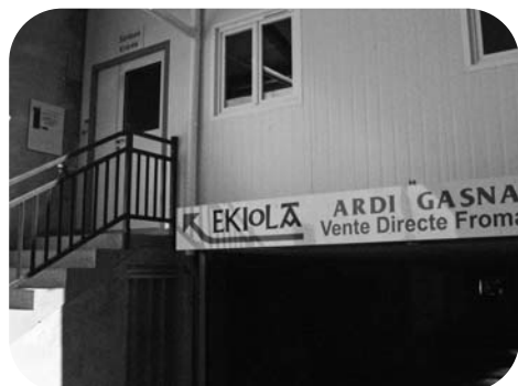
Quelques unités de production en Pays Basque Intérieur