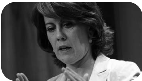
Yolanda Barcina, la Présidente du gouvernement de Navarre