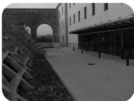
L'université de Bayonne, pas assez connectée aux besoins locaux

Cette insuffisance concerne le foncier et l'immobilier en entreprise. Cela se traduit par un manque de programmation de l'aménagement et de la viabilisation de zones d'activités (ce point ressort particulièrement de l'enquête que nous avons menée auprès des entreprises de plus de 20 salariés). Anticipation que l'on pourrait étendre à la question de la gestion prévisionnelle des emplois et des compétences qui va concerner nombre d'entreprises et de filières dans un proche avenir.