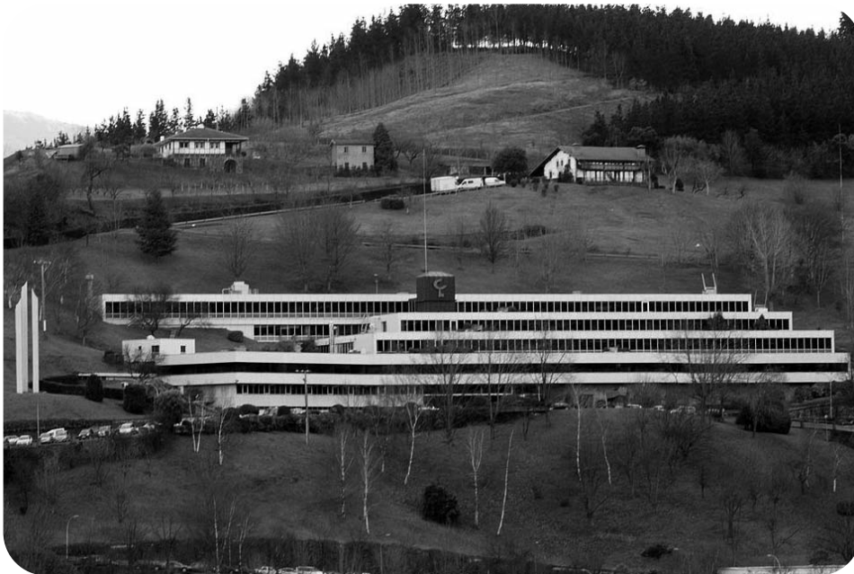
Euskadiko Kutxaren egoitza nagusia Arrasaten

Bankoak krisian dira munduan, baina bereziki Espainian. Goiz guziz Euskadi Irratia entzutean Euskadiko kutxa edo Caja laboralen publizitatea egitean erraiten dute : « Bada beste modu bat ».