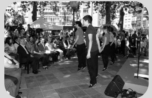
Dantza omenaldi bat