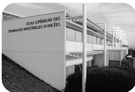
L'ESTIA forme les futurs cadres du Pays Basque

Par ailleurs, on ne peut ignorer la problématique qui n'est pas spécifique au Pays Basque du rapport actuel des jeunes à l'emploi, au projet professionnel : beaucoup de jeunes se projettent dans l'immédiat au prix d'une précarité sociale et professionnelle acceptée comme un système de vie. Aussi, l'emploi en CDI, la formation qualifiante en longue durée, la mobilité professionnelle, la construction d'un projet à moyen terme sont pour nombre d'entre eux des données à contre culture.