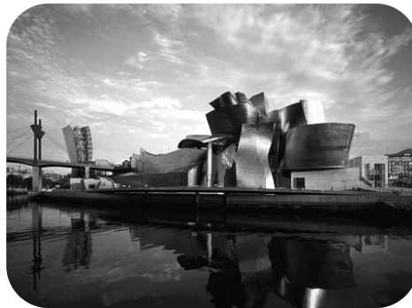
Le musée Guggenheim à Bilbao

de ses pires crises. L'union elle-même et sa monnaie sont remis en cause. Euskadi affronte mieux cette crise que l'Espagne et le reste des pays du Sud de l'Europe, ceux qui ont été nommés les PIGS. Mais les problèmes des autres ne sont en aucun cas une consolation et encore moins un remède. Comme nous l'avons dit auparavant, le Parti a une réflexion issue du processus Think Gaur sur le type de pays que nous voulons et le modèle de société auquel nous aspirons. Une