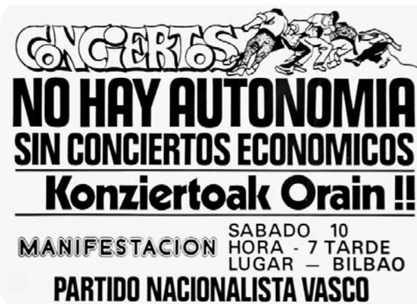
Une propagande en faveur du Concierto Economico

Euskadi réinstaura ses institutions démocratiques avec deux facteurs importants qui conditionnaient le tout : le politique et l'économique. Le pays