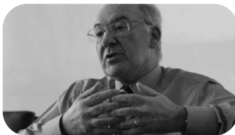
M res Ardanza

prises innovantes qui firent de la recherche et du progrès continu, leur manière d'être. L'exemple de tout cela est le musée Guggenheim, qui fût créé durant cette décennie dans la polémique. L'histoire a démontré la justesse de toutes ces initiatives.