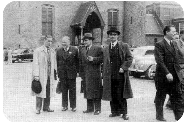
Une délégation basque lors d'une rencontre européenne avec Javier De Landaburu, Jose Antonio Agire et Jesus Mari Leizaola

Fédéralisme et Indépendance peuvent converger en prenant en compte la cession obligatoire de l'exercice de la souveraineté dans les organes fédéraux de l'Union. C'est une trajectoire qui nous conduit de l'indépendance à l'interdépendance. Le concept de l'État nation, comme il fut conçu depuis le Traité de Westphalie au XVII e siècle est dépassé par l'histoire, tout comme les concepts classiques de souveraineté ou d'indépendance. L'Etat gère une structure obsolète, trop grande pour offrir les services de base aux citoyens et trop petite pour affronter les défis de la globalisation. Les Etats actuels cheminent de l'indépendance vers l'interdépendance, comme le montre la terrible crise européenne qui nous affecte. Notre aspiration est de convertir la Nation basque en sujet politique des futurs Etats Unis d'Europe.