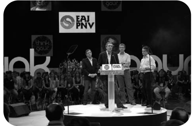
Un Meeting du Think Gaur Euskadi 2020

nistes, celles qui changent leurs valeurs et qui mettent de l'effort dans ce qu'elles font. Pour EAJ-PNB, cela a toujours été clair. Sans personne, il n'y a pas d'avenir, il n'y a pas de parti, il n'y a pas de pays. Et sans des personnes qui innovent en permanence non plus. La dernière initiative du Parti se nomme Think Gaur. Nous avons mené une réflexion globale sur ce que nous sommes aujourd'hui et le plus important, comment nous voulons être dans le futur. Pourquoi dans le monde actuel, il n'est pas suffisant de savoir comment un pays veut être. Le but est d'y parvenir en étant économiquement durable et financièrement équilibré.