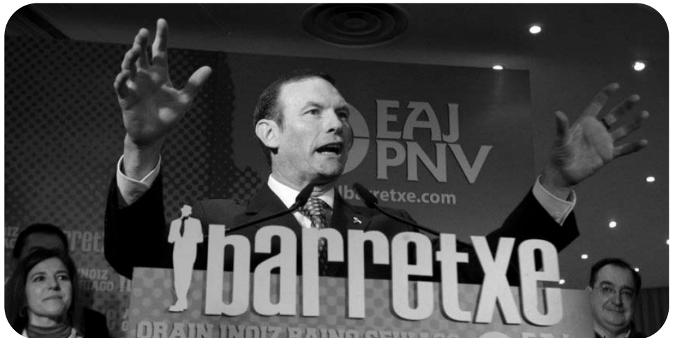
Le Lehendakari Ibarretxe en campagne

oblige l'Etat à négocier la proposition qui vient d'Euskadi.