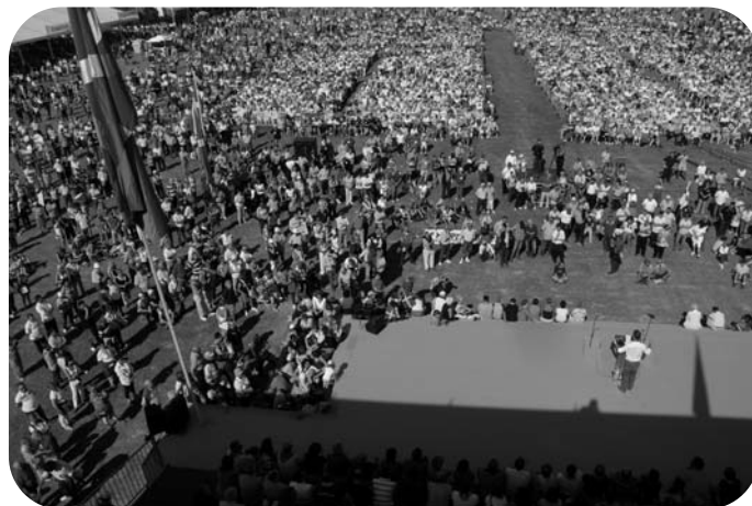
L'Alderdi eguna, une fête populaire

Ce fut un immense succès où se retrouvèrent dans un même lieu des générations de militants et les vieux gudaris qui défilaient sous le sigle de leur bataillon.