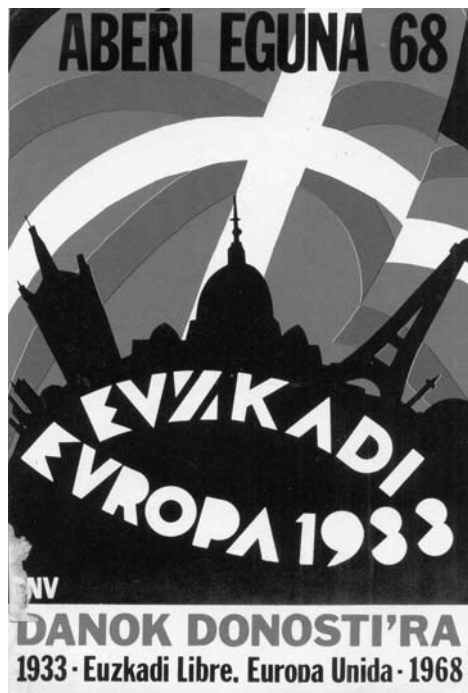
Une affiche de l'Aberri Eguna de 1933

La première réunion internationale à laquelle a participé EAJ-PNB fût la IIIe conférence des Nationalités célébrée à Lausanne en 1916, au milieu des hostilités de la première guerre mondiale. Dans cette grande Assemblée, les délégués basques ont défendu la lutte et les droits des petites nations "qui ne se mesurent ni par le nombre d'habitants ni par ses kilomètres carrés".