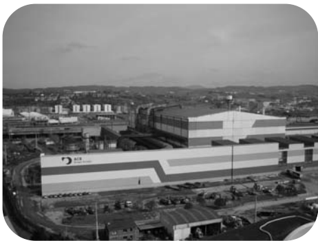
L'aciérie compacte de Biscaye

menions à bien des politiques pour notre pays que nous pensions en toute humilité les plus justes. Le temps a également remis chacun à sa place. La pacification fut également un autre des défis du Lehendakari Ardanza. Il fut capable de mettre d'accord tous les partis pour rejeter la violence d'ETA, pour défendre une sortie du conflit par le dialogue et pour mettre en évidence que le non accomplissement de l'auto-gouvernement basque était une des meilleures excuses fournies aux radicaux. Le Pacte d'Ajuria Enea instaura l'unité face à ETA, un accord pour l'accomplissement intégral du Statut de Gernika et la recherche d'une sortie dialoguée à la violence d'ETA. Les partis nationalistes espagnols (Parti Socialiste et Parti Populaire) finirent par rompre cet accord. Le dernier document de la Mesa de Ajuria Enea qui prônait la fin d'ETA, par le dialogue et par le respect de la décision adoptée par les Basques resta à nouveau lettre morte.