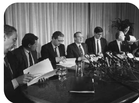
Les signataires du pacte Ajuria Enea

prévu dans la Constitution espagnole. Il dut dédier des heures et des heures à défendre le fait qu'Euskadi ne voulait pas et n'essayait pas de porter préjudice à une autre communauté ou à l'Etat lui-même. Simplement, nous