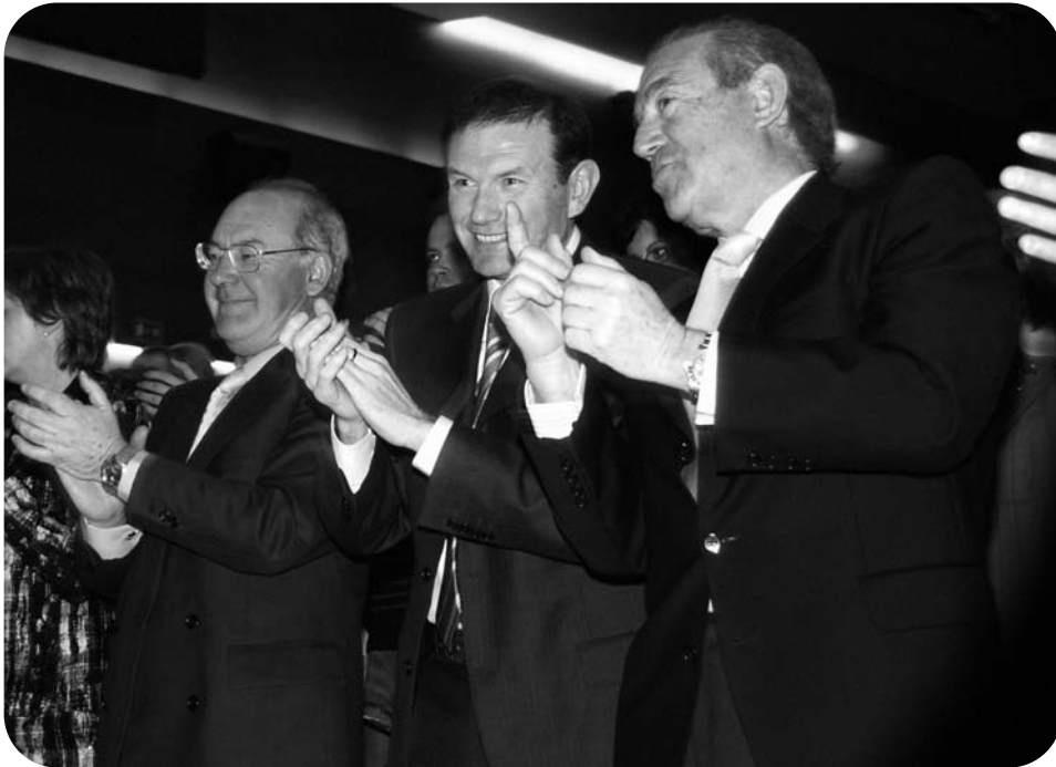
Les trois lehendakaris : M res Ardanza, Ibarretxe, et Garaikoetxea

de progresser et de faire avancer notre pays. Nous comptions également sur un monde de l'économie sociale et coopérative très important. De fait, des expériences comme celle de Mondragon Corporacion Cooperativa n'ont eu lieu nulle part ailleurs dans le monde. Une des premières préoccupations fut de moderniser notre pays, nos entreprises et de nous mettre à travailler ensemble pour sortir du tunnel du franquisme.