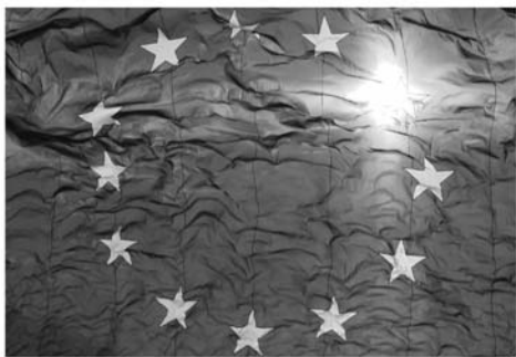
Le rêve européen

les Peuples soient présidées par la coopération et la solidarité.