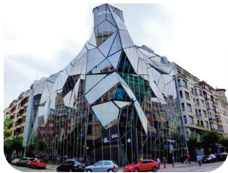
Le siège d'Osakidetza, le service basque de la santé

Afin de réussir dans ce XXI ème siècle, Euzkadi doit compléter le développement de son système d'éducation. Ce