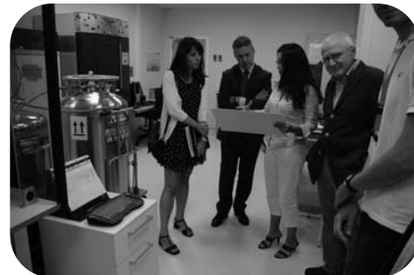
L'innovation est au cœur des préoccupations d'EAJ-PNB