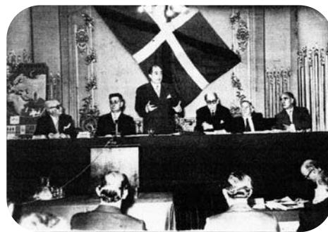
Jose Antonio Aguirre au Congrès Mondial Basque

Aguirre fit un long discours consacré à « Vingt ans de gestion du Gouvernement Basque (1936-1956) ». Les jours suivants, les congressistes écoutèrent les rapports et les discussions qui suivirent des quatre sections : Politique, Culturelle, Socio-Economique et « Les Basques dans le Monde ».