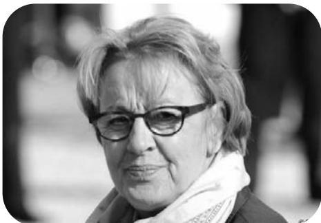
Une personne décisive : M me Lebranchu, Ministre de la Décentralisation

À l'issue de l'Assemblée Générale du Conseil des Elus, une large majorité de 25 voix a décidé d'approuver la création de cette institution, alors que des socialistes ont présenté deux motions qui éluaient cette demande. C'est une nouveauté puisque pour la première fois, une contestation a vu le jour. Cette protestation est néanmoins ambiguë. 7 élus socialistes présentent une motion mais ils refusent de voter contre la motion majoritaire favorable à la Collectivité Territoriale. Leur agissement a été irrespectueux envers le Conseil de Développement et le Conseil des Elus.