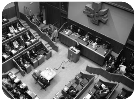
Le Parlement Basque

Le Parlement basque actuel compte 30 députés d'EAJ-PNB, 25 du Parti Socialiste, 13 du Parti Populaire (droite espagnole), 4 d'Aralar (un parti de la gauche abertzale), 1 d'Eusko Alkartasuna, 1 d'Ezker Batua (les communistes et écologistes espagnols) et 1 de UPyD (centralistes espagnols). EAJ-PNB est le premier parti de la dernière Assemblée, après avoir obtenu près de 39% des voix, mais la coalition PSE-PP avait permis l'élection de Patxi Lopez, comme Président ou Lehendakari. La stratégie anti-abertzale avait pleinement fonctionné. Pas de candidature de la gauche abertzale historique pour cause d'interdiction, EAJ-PNB relégué dans l'opposition et un Lehendakari qui ose malgré tout déclarer une politique d'entente entre différents, en créant un front espagnol et en ignorant la majorité sociale abertzale.