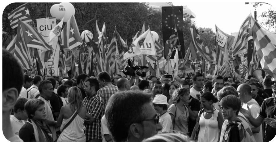
1 catalan sur 5 dans les rues de Barcelone !

convoquera des élections qui auront un caractère plébiscitaire car tous les partis partisans d'un État porteront dans leur programme la proclamation de cet État. Puis on proposera à Madrid de discuter des modalités de la séparation. Le « problème » catalan ne sera plus un problème interne espagnol, mais un problème européen et international. Il sera donc traité conformément au Droit International, par un référendum où une majorité du peuple catalan aura à répondre à une question claire et précise : « Voulez-vous que la Catalogne soit un État Catalan dans le cadre de l'Union Européenne ? »