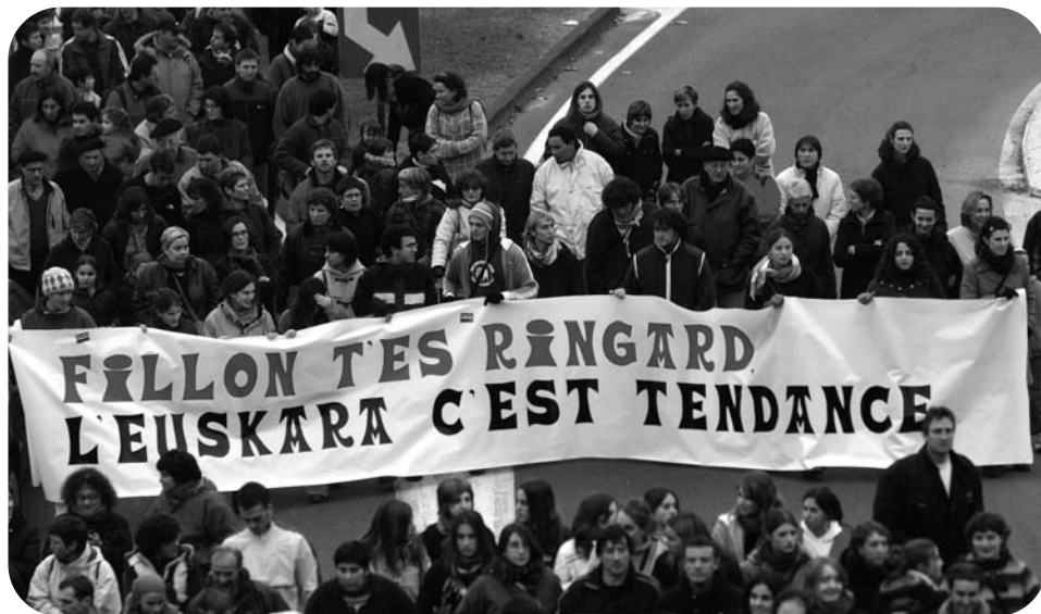
Manifestation en faveur de l'euskara

L'euskara continue à régresser en Pays Basque nord, selon la V e enquête sociolinguistique menée sur l'ensemble du Pays Basque, Communauté Autonome Basque et Navarre comprise. Constat sans appel et récurrent depuis la première enquête sociolinguistique menée en Pays Basque nord. Sans tomber dans la démagogie facile et le catastrophisme, beaucoup de voyants sont au rouge.