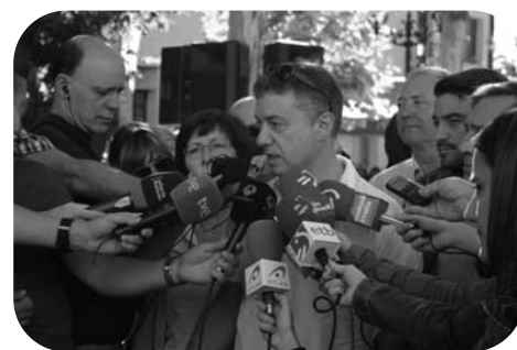
Une campagne médiatique intense

fin de la dictature franquiste. Il devient un militant actif d'EGI, le mouvement de jeunes du Parti. Il présidera ce mouvement et réalisera un discours, à l'occasion du mémorable Alderdi Eguna de 1983, à Aixerrota.