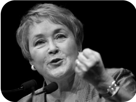
Pauline Marois victorieuse

C'est le Parti Québécois (PQ) mené par Pauline Marois qui a remporté les élections générales du 4 septembre dernier. Avec près de 32% des voix et 54 sièges, le PQ domine la nouvelle assemblée nationale québécoise et est revenu au gouvernement de la belle province après une éclipse de 9 ans.