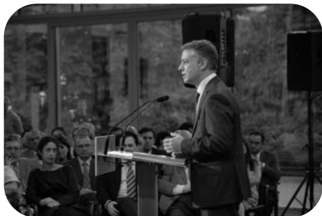
Iñigo Urkullu présente ses nombreuses propositions

depuis plus d'un an, par plus de 3 500 personnes. Les autres mènent une campagne négative de critique systématique contre EAJ-PNB, avec des arguments purement querelleurs et souvent démagogiques peu à même de réconcilier les citoyens avec la politique. Iñigo Urkullu refuserait un débat avec Patxi Lopez, alors que rien ne justifie ce face à face dans le cadre d'une campagne où l'égalité de parole prévaut entre les candidats. EAJ-PNB aurait un pacte occulte de coupes sombres sans apporter le moindre début de preuve et en faisant une analogie simpliste entre la « droite basque » et la droite espagnole. Voter EAJ-PNB reviendrait à voter pour l'indépendance, alors qu'EAJ-PNB défend ouvertement un projet de nouveau statut... Iñigo Urkullu a fixé pour priorité la lutte contre la crise pour mener le deuxième redressement d'Euskadi. Il souhaite également consolider le vivre ensemble en Euskadi et doter la Communauté Autonome Basque, d'un nouveau statut politique, en 2015.