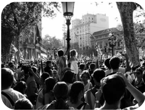
1,5 million de manifestants catalans dans les rues de Barcelone

Mardi 11 septembre un million et demi de Catalans ont défilé à Barcelone pour demander l'indépendance. La Diada c'est l'Aberri Eguna de la Catalogne. Tous les partis sauf le PP étaient présents. Cette manifestation énorme a beaucoup marqué les esprits. Par ces temps de crise la Catalogne souffre beaucoup car 25% des impôts catalans vont à Madrid. En 1980, les Catalans n'avaient pas accepté comme Euskadi le risque de lever l'impôt eux-mêmes, c'est pour cette raison qu'ayant une dette importante ils ont du demander l'aide de Madrid, comme Valence et Murcie, 2 régions très endettées. Les Catalans excédés de cette situation sont venus en masse débordant leurs partis politiques en scandant : La Catalogne prochain Etat de l'Europe.