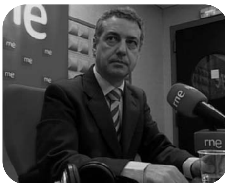
Iñigo Urkullu Irrati saio batean

osasan, hezkuntza, euskara, berrikuntza, enpresa edo lankidetzeta esparruetako ordezkariak eta Iñigo Urkullurekin harreman berezia izan duten pertsonak egingo dituzten ekarpenekin.