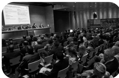
Assemblée Générale du cluster Uniport port de Bilbao

investir dans quelques programmes de recherche ou dans la création d'institut sectoriel de recherche. Aussi, le cluster de la construction navale développe des programmes de recherche spécifique pour l'élaboration de nouveaux systèmes d'isolation pour les cuves alors que le cluster de la machine-outil préfère créer ses programmes dans sa propre fondation de recherche.