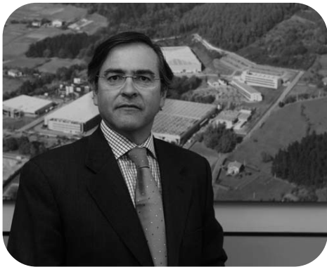
Président du cluster Hegan

Il s'agit d'une concentration géographique d'entreprises et d'institutions interconnectées dans un domaine donné. Les clusters regroupent donc les entreprises et entités qui sont importantes pour leur compétitivité. En effet, ils prennent en compte par exemple les fournisseurs, les fabricants de produits complémentaires et/ou d'autres entreprises industriellement liées au niveau technique ou technologique. Les clusters coopèrent aussi avec les gouvernements ou avec d'autres institutions telles que les universités, des groupes de réflexion, des centres de formations et des sociétés commerciales qui vont apporter au cluster des formations spécialisées, de l'information, de la recherche et du support technique.