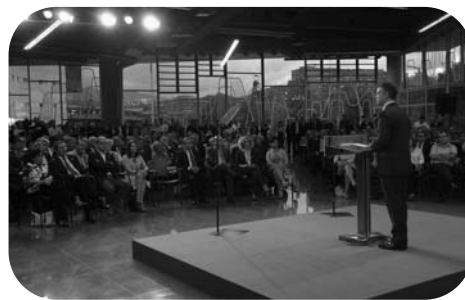
Iñigo Urkullu lors de la présentation du programme