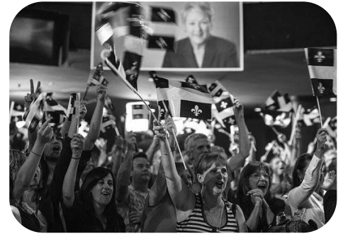
Explosion de joie au siège du PQ

Devant cette victoire étriquée du PQ, les regards se tournent avant tout vers Pauline Marois. La nouvelle première ministre a su concilier une vie de famille bien remplie