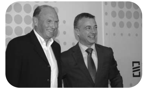
Iñigo Urkullu avec Juan Jose Ibarretxe

Une Euskadi, nation européenne, dans la paix.