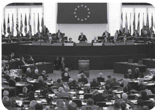
Le Parlement européen

PIB le déficit total de leurs finances publiques. Dorénavant, les Etats doivent s'engager à financer leurs dépenses courantes par des recettes et non pas par l'emprunt, mais ils gardent la possibilité de soutenir leur économie par un déficit exceptionnel, qui pourra dépasser dans certains cas les 3% de l'ancienne règle, à condition qu'il s'agisse de mesures temporaires justifiées par des circonstances exceptionnelles.