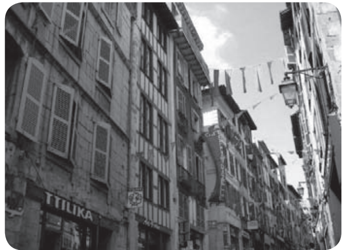
Bayonne et le BAB, la zone faible du bilinguisme

tranche d'âge au-dessus, des 25-34 ans, celle qui n'a pas bénéficié de cette « politique linguistique », la progression est de +2,3 % de locuteurs (on passe là de 11,6 % à 13,9 %). Pire, durant la période de 2006 à 2011, le pourcentage des habitants du Pays Basque défavorables à la promotion de l'euskara est passé de 17,3 % à 21,3 % ! Celui des favorables baissant tout aussi fortement de 41,2 % à 38,5 % ! Mais en stratégie de moti-