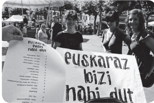
Une nécessaire mobilisation populaire

grâce à l'enseignement bilingue. Voilà une belle valeur à laquelle nous sommes attachés, et que personne ne pourra nous enlever.