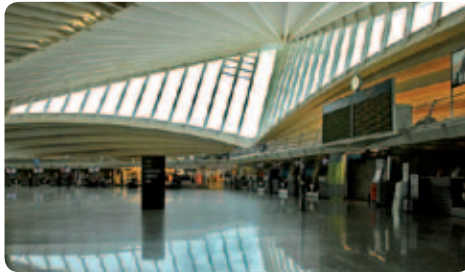
L'intérieur du nouvel aéroport de Bilbao

Le processus d'élection du « Maire du Monde 2012 » a commencé en Janvier, lors d'une première phase qui permit de retenir 900 maires. En Juin 2012, la fondation a élaboré une liste de 25 finalistes. Une liste qui incluait 5 maires d'Amérique du Nord, 4 d'Amérique latine, 7 d'Europe, 5 d'Asie, 2 d'Australie et 2 d'Afrique. Plus de 463 000 personnes et organisations du monde