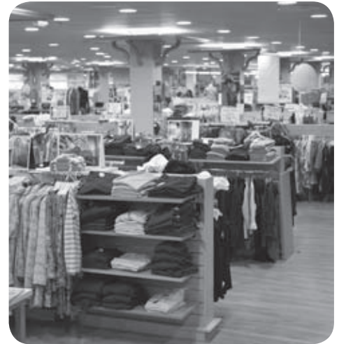
Les commerçants des bourgs centre s'organisent à l'échelle du Pays Basque intérieur

son travail et non plus uniquement par les subventions, d'une alimentation de qualité et d'une agriculture intégrée à son environnement, alors il faudra que le consommateur se mette en tête de quitter un cercle vicieux où il veut payer de moins en moins pour une alimentation qui est extrêmement déséquilibrée, en particulier protéinée.