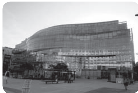
Le siège du gouvernement basque

En 2012, un Biscayen bénéficie en moyenne de 6095€ venant de la diputacion de Biscaye et du Gouvernement Basque, un Gipuzkoan quant à lui per-