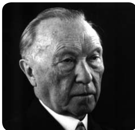
Konrad Adenauer, le chancelier de la réconciliation franco-allemande

L'argent est le nerf de la guerre ... l'Union européenne ne déroge pas à la règle. Depuis plusieurs mois, les capitales européennes s'écharpent sur la question des perspectives financières pour les années 2014-2020. Lors d'un sommet en novembre dernier, aucun