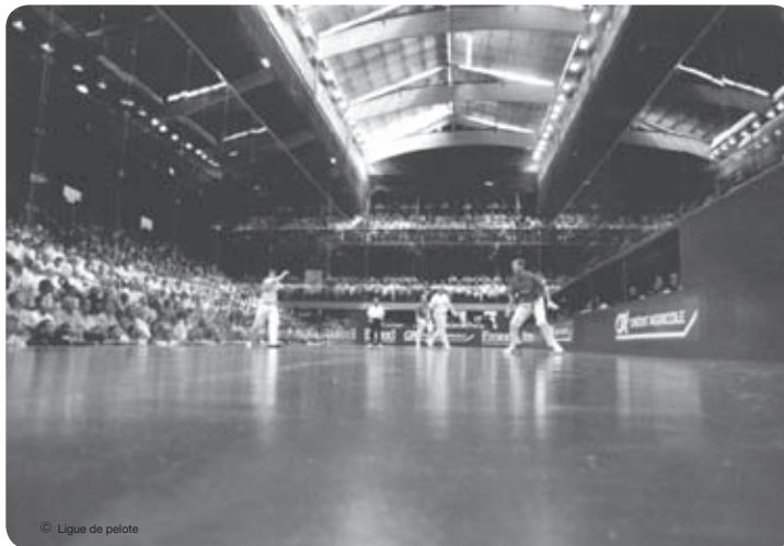
Trinquet moderne de Bayonne

Oui bien sûr. Les personnes qui ont la quarantaine sont encore imprégnées par cette culture sportive. Je suis plus inquiet concernant les jeunes