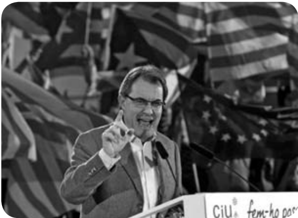
Artur Mas, Président CiU de la Généralitat de Catalunya

nationalisme des régions périphériques est fort car il s'est structuré depuis 20 ans. Ils sont des acteurs du paysage politique. Ils font partie depuis lors du système politique en place. Ils ont une représentation dans des Parlements où ils peuvent agir. En France, nous ne sommes pas dans ce cas, les régions ont trop peu de pouvoirs et de légitimité. A part l'administration d'un territoire, il y a peu de marges de manœuvres