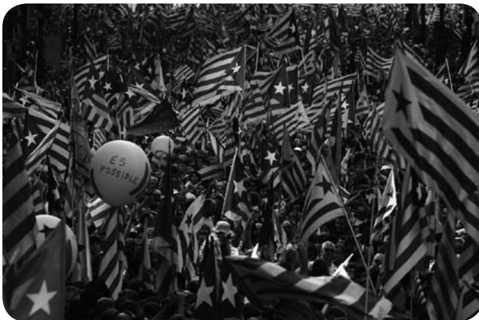
L'historique manifestation de la Diada le 11 septembre dernier avec 1,5 million de personnes.

Les seules véritables réponses publiques viennent des territoires. Il faut réussir à décider dans les territoires. Il y a une crise du système de représentation par manque d'élections plus justes car les représentants politiques sont élus pour être immédiatement emprisonnés dans leur limite de marge de manœuvre. A ce problème des lieux véritables de gouvernement vient s'ajouter un problème lié à la mauvaise représentation des aspirations