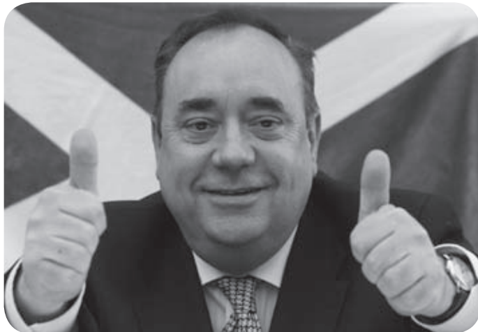
Alex Salmond, Premier ministre écossais du SNP (Scottish National Party)

De façon générale, le Royaume-Uni est un système monarchique qui, comme l'Espagne, accorde traditionnellement une certaine forme d'autonomie à ses