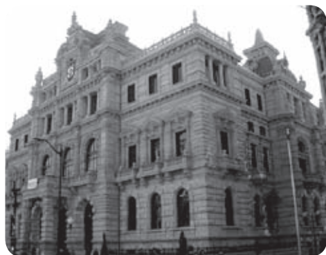
Le siège de la diputacion de Biscaye

Tous les grands pays occidentaux sont fortement décentralisés à l'exception de la France. La force du pouvoir local n'a jamais été aussi évidente qu'aujourd'hui dans bien des domaines : l'action sur l'environnement qui dépend du type de territoire. Les politiques sociales supposent de bien connaître au plus près chaque personne. En matière économique, des chercheurs comme Bernard