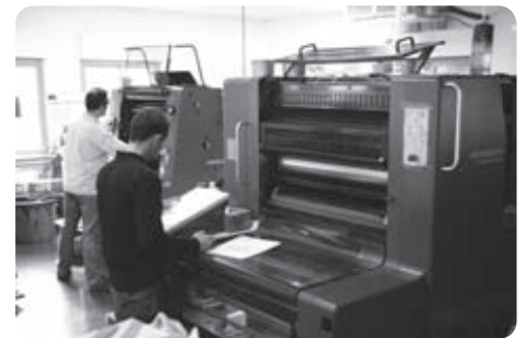
Le développement des P.M.E., une priorité en monde rural

. le fonctionnement des PME en réseaux. Ce fonctionnement permet des économies financières par le jeu des sous traitances, des investissements communs, de gagner plus facilement en flexibilité ou en capacité... Il permet également un partage des informations du marché qui peuvent