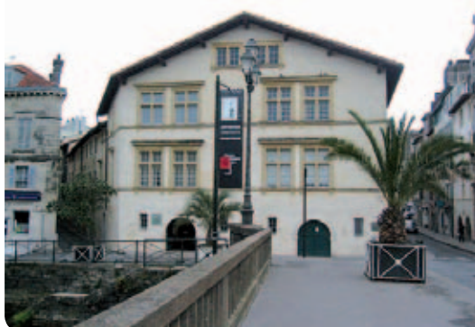
Le musée basque

région administrative sans âme, sans sentiment culturel commun qui est largement dominée et concentrée sur le bassin de vie de Bordeaux, sa capitale administrative et du département de la Gironde. En 2010, sur 3 232 352 Aquitains recensés, 1 449 245 d'entre eux sont Girondins. Près de 50%, exactement, 44.83% des Aquitains sont Girondins. 4 villes d'Aquitaine ont plus de 50 000 habitants, 3 d'entre elles sont Girondines et sont situées dans l'agglomération bordelaise, Bordeaux,