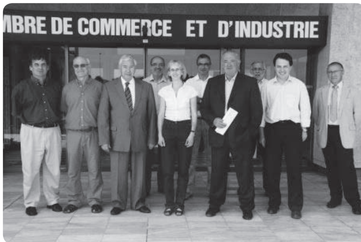
Les responsables du Cluster Uztartu, lors de sa création à la CCI Bayonne Pays Basque

Dans chaque filière, viande bovine, ovine, lait de brebis, de vache, porcs, cerise ou piment etc les acteurs ma-