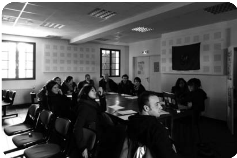
La formation et l'implication locale : 2 principes fondateurs d'Euskaldun Gazteria