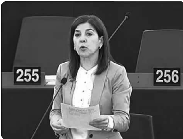
Izaskun Bilbao, l'euro députée Jeltzale, au Parlement européen

teur des attentes ... surtout pour la France : les fonds de la PAC vont baisser de 13% mais le coup de rabot pour les agriculteurs français ne sera que de 3%, ceux-ci recevront une enveloppe de 55,8 milliards d'euros entre 2014 et 2020, alors qu'elle était de 57,3 milliards d'euros pour la période 2007-2013.