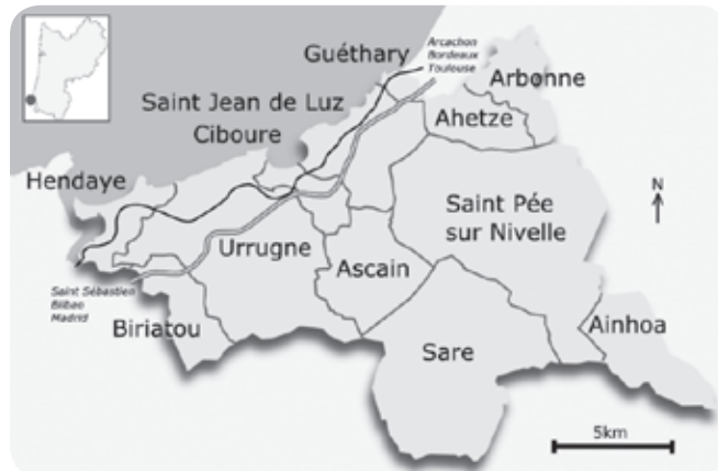
Une agglomération composée de 12 communes

Dans le domaine économique, création de parcs d'activités à Sare, Ascain, St Pée, Ainhoa. En projet, ceux d'Arbonne, Urrugne, St Jean-de-Luz, Ahetze, St Pée.