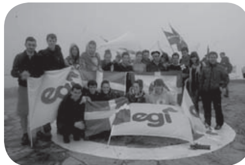
Un groupe d'EGI à la fête de l'Ikurriña, le 14 juillet dernier.

EGI est l'organisation des jeunes d'EAJ-PNB, au sein de laquelle les jeunes de 16 à 30 ans participent directement à l'élaboration et au développement de la politique jeltzale, particulièrement en ce qui concerne la jeunesse. Les jeunes d'EGI développent des activités spécifiques de formation politique, culturelle, sociale à différents niveaux.