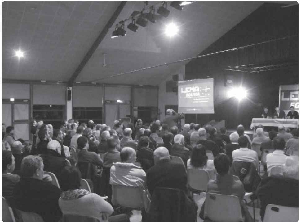
Un débat entrecoupé de vidéos avec des témoignages d'entrepreneurs locaux

pas évident ». Mixel Etchebest donne l'exemple d'une action qui commence à être menée avec l'EPFL, l'Etablissement Public Foncier Local : « l'EPFL est en contact avec toutes les intercommunalités du Pays Basque pour tenter de repérer à l'échelle du Pays