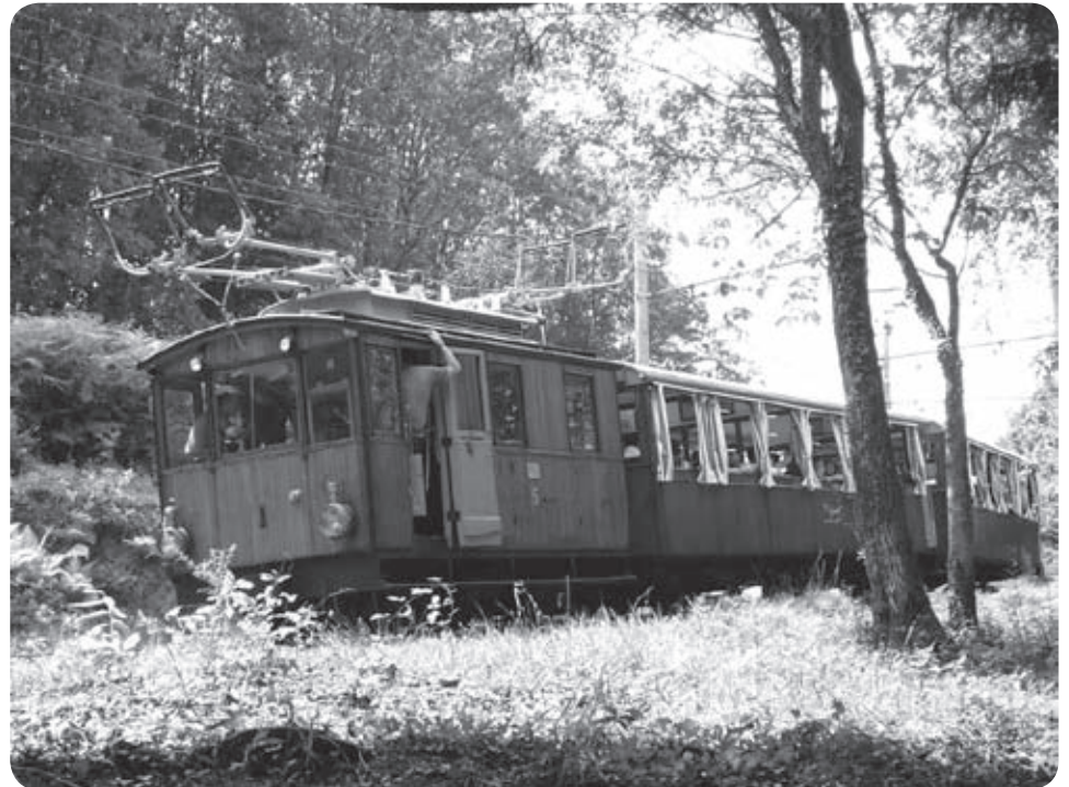
Le petit train de La Rhune : un chantier traditionnel de l'entreprise Barland

avant que cette zone ne s'urbanise. Les habitants des alentours ont donc l'habitude de notre présence. Notre activité ne génère pas de problèmes particuliers, puisque nous ne travaillons qu'en journée.