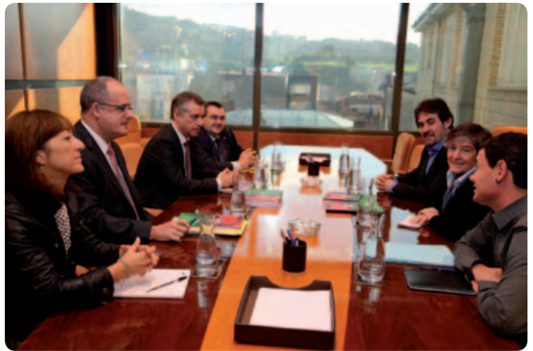
EAJ-PNB eta EH Bilduko ordazkarien arteko harremanak zailak dira