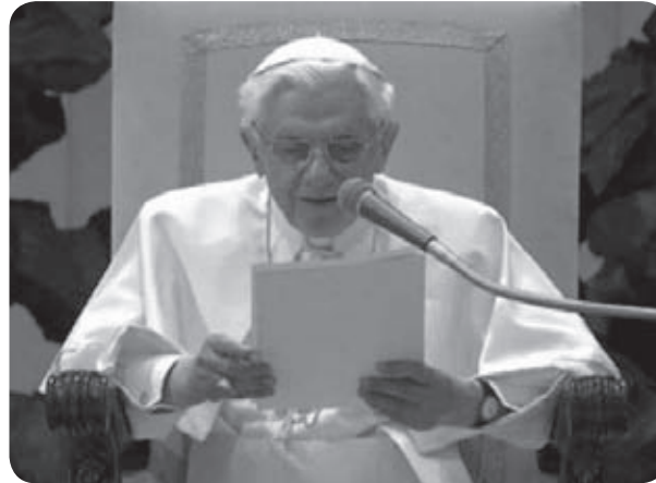
Aita Sainduaren azken hitzak

Ezina, erlijioarekin zerikusirik ez duten bestelako jokabideei lepokoa jartzeko: sexu gehiegikerien aurrean