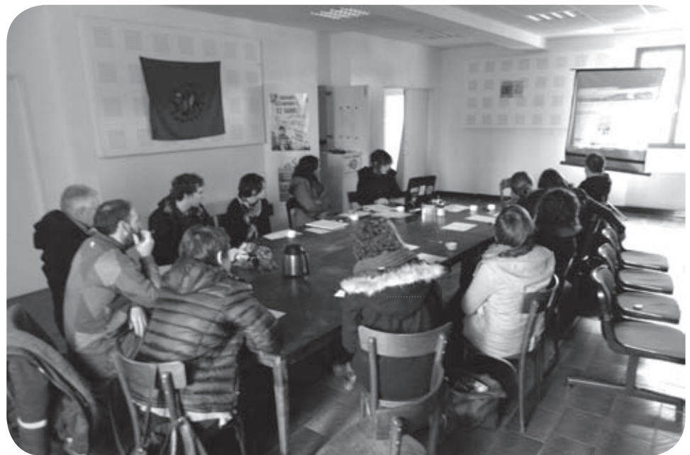
Réunion de réflexion des jeunes d'Euskaldun Gazteria

Notre association n'a jamais été un groupe politique. Par contre Euskaldun Gazteria a offert une ouverture à