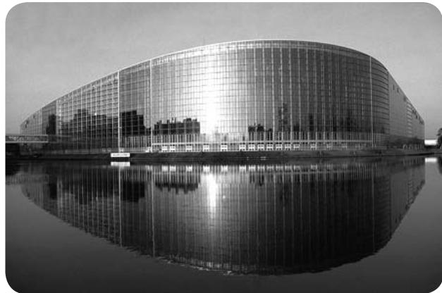
Europako Parlamentua, Estrasburgon

Cet Etat ne supporte guère les contre-pouvoirs. Ses institutions, relativement cadencées, ne laisse que des miettes aux minorités. Prime majoritaire aux élections municipales et régionales, absence quasi-totale de proportionnelle, scrutins uninominaux