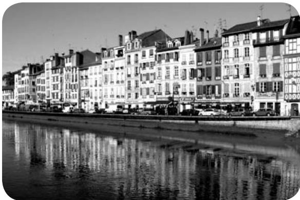
Baionako Lapurtar etxeak, etxebizitza merkatu tentsiodun batean

(comme 75% des ménages), il paiera sur le BAB un loyer T3 environ 850€/mois soit 40,4% de son budget ! Et ce couple n'aura aucune aide puisque soi-disant trop riche pour bénéficier d'un logement social !!! D'où l'urgence de construire plus de logements afin de relever les plafonds de revenus donnant accès aux logements sociaux et permettre ainsi aux classes moyennes d'en bénéficier. Quant à l'accession à la propriété, elle se fera par le choix obligatoire de l'éloignement, là où les prix sont les