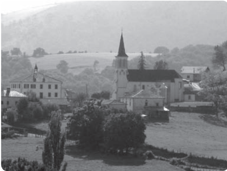
Izura herria, konpostelako bideen erdi gune nagusian

Le syndicat mixte « Baxe-Nafarroa » est aujourd'hui engagé dans une mue institutionnelle. L'étape des projets en commun, menés depuis 10 ans, laisse