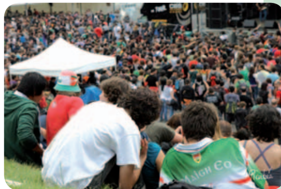
Laster, Herri Urrats, Iparraldeko ikastolen pesta

Sans anticiper sur les objectifs de cette politique linguistique, et sans abandonner le combat pour l'officialisation de l'euskara, il me semble que ce partenariat préférentiel avec la Région doit être l'occasion, comme le PNB ne cesse de le rappeler depuis trois ans, de négocier un véritable « statut territorial de l'euskara ». Cela nous permettra d'attendre efficacement l'obtention de la collectivité territoriale Pays Basque.