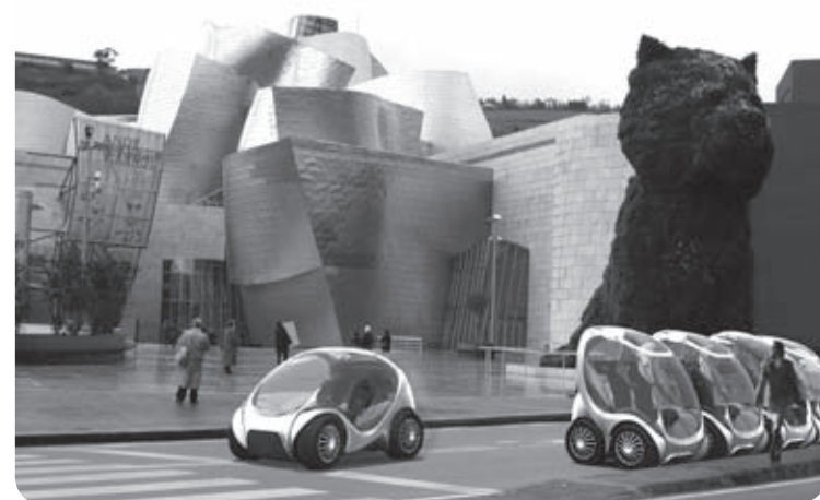
Hiritiko ibilgailu elektrikoak, biharko euskal ibilgailu bat ?

Ils ont accueilli favorablement ce changement puisque nous amenions une amé-