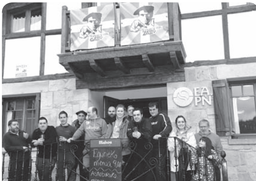
Bizkaitarrak, Bizkargin, mendizaleen tradizioan

Les « djihadistes » ne pardonnent toujours pas aux nord-américains leurs interventions sur des terres « musulmanes ». Pourtant, chaque semaine, en Irak, au Pakistan, des attentats bien plus sanguinaires, détruisent la vie de dizaines de musulmans, qu'ils soient Sunnites ou Chiites !