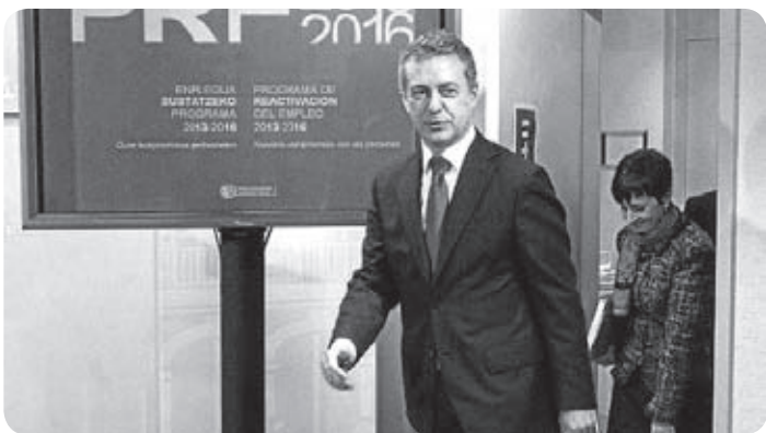
Urkullu Lehendakaria, bere enplegu plana aurkeztu aintzin

• Le travail n'est pas créé par décret. Cependant, les politiques publiques peuvent et doivent créer un environnement public et les conditions qui favorisent la création de nouveaux emplois. Le Gouvernement Basque travaillera en générant un cadre public qui encourage l'investissement pour la création d'emplois, la priorisation et la promotion de toutes les initiatives publiques et privées qui contribuent à maintenir et à créer des emplois en Euskadi.