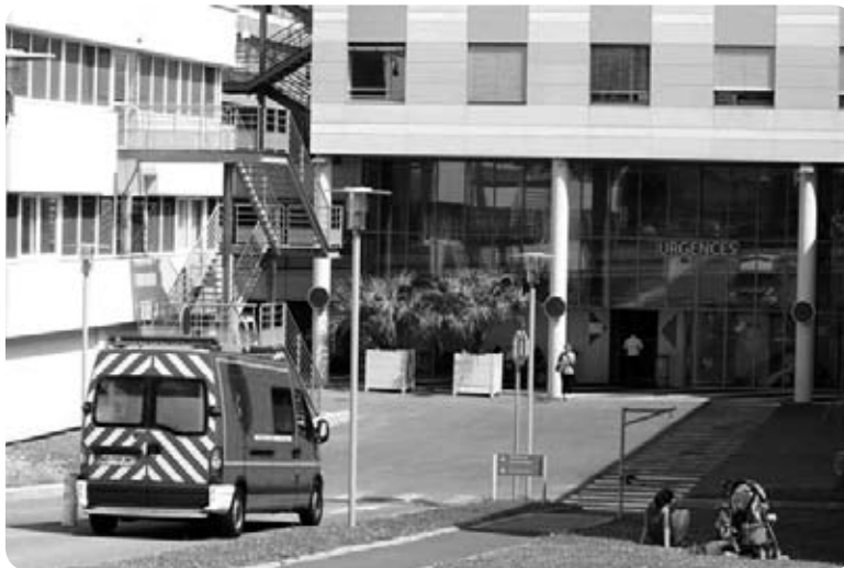
Baionako eri etxe publikoa, tresna baliagarria Iparraldeko barnekaldearentzat ?

Bien que la Côte Basque concentre la majorité de la population et des acteurs de santé (hôpital, établissements privés de soins, médecins spécialistes), on ne peut ignorer les besoins du Labourd