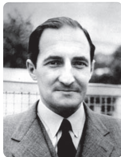
Jose Antonio Agirre-ren orroitzapenean

Ce Centre impulsera l'étude et la recherche de ces modèles. Il étudiera l'application de ces modèles et en particulier, le modèle basque. De plus, ce