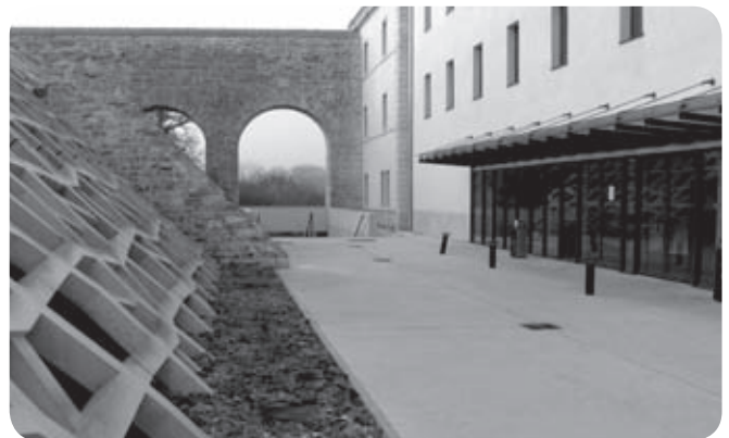
Unibertsitate berri bat, tokiko beharrei loturik ?

De façon générale, beaucoup de questions, de réflexions et un SCOT qui sur l'ACBA et le Sud des Landes arrive beaucoup trop tardivement pour faire face à l'installation de plusieurs centres commerciaux, Ikea, à Bayonne ou celui d'Ondres, pour les plus significatifs, soit une armature commerciale équivalente à celle de l'agglomération de Toulouse ! Une agglomération qui est déjà saturée sur le marché du foncier accroit encore les emplois résidentiels déjà surreprésentés. L'heure est à la recherche d'emplois rémunérateurs qui le sont