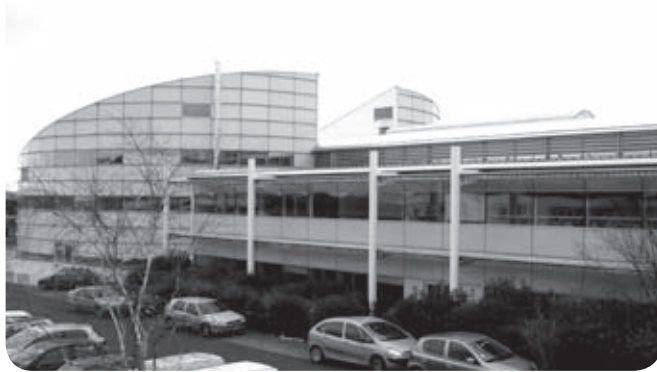
ESTIA, ingeneritza eskola, Izarbel teknogunean

La gestion des territoires du Gipuzkoa ou de la Biscaye pourrait être également une source de réflexion et d'inspiration. Enfin, l'idée d'un SCOT Pays Basque pourquoi pas ? Mais qu'au minimum, cet espace urbain et péri-urbain s'organise pour traiter des problèmes urgents qui le concernent en priorité. Ne mettons pas la charrue avant les bœufs !