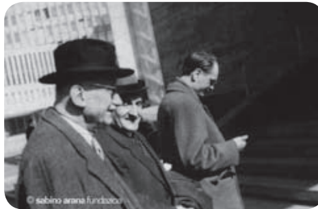
Europako sortzaileak : muga gizonak, JA. Agirre (erdian), R. Schuman-en ondoan

L'idée de coopération va devenir effective grâce notamment à Robert Schuman qui, dès 1950, propose de mettre les ressources en charbon et en acier sous la responsabilité d'une haute autorité commune à la France