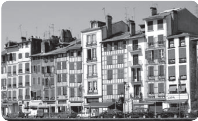
Ipar Lapurdiko hirigintza elgarrekin gogoetatua

Au niveau du foncier, il est prévu que d'ici à 2015, le territoire devrait accueillir 9500 nouveaux habitants et 8500 nouveaux logements. Ces prévisions se confirment-elles ? Les logements sociaux sont la priorité des priorités. Cette croissance de la population affectera les services à la personne. Il faut trouver « les secteurs propices au renouvellement urbain et à la continuité des zones urbaines actuelles », les communes du Labourd intérieur sont donc directement concernées, celles de la côte étant déjà largement saturées. Objectif : garantir un logement de qualité à tous, limiter l'étalement urbain ».