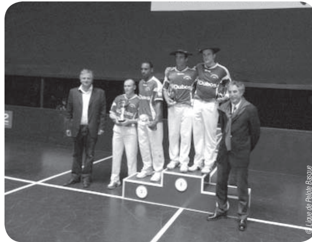
Angeluko lehiaketaren torneoaren irabazleak