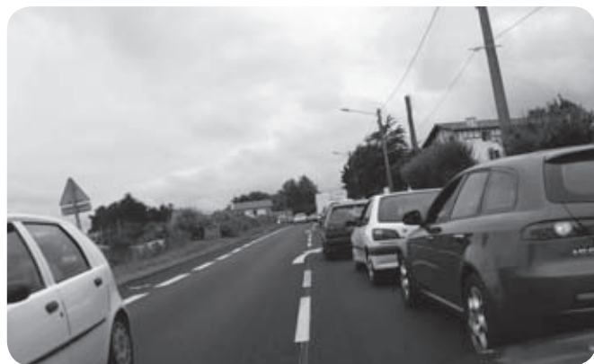
Bideen ber-egituraketaren beharra

En quoi l'eurocité a été boosté par cette zone motrice ? Y a-t-il eu durant ces années interconnexion entre l'eurocité et la Communauté de Communes ? Mise à part des principes généraux, rien de précis. Il est vrai que