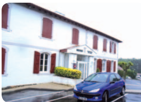
Basusarriko Herriko Etxea

Nous travaillons beaucoup sur le logement, notamment sur l'accession à la propriété des jeunes de Bassussarry et des communes alentours, d'une part pour répondre à notre niveau à la demande locale et amener des jeunes