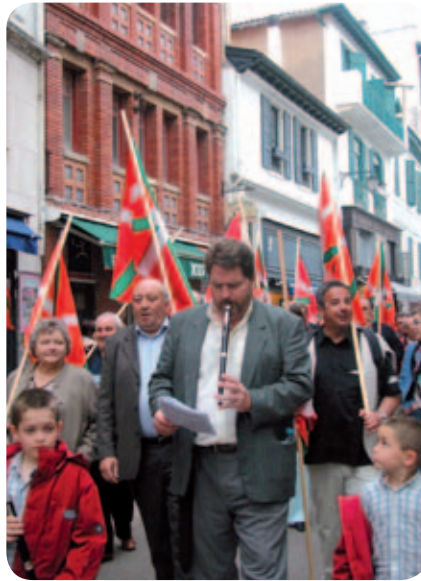
Alderdikideak mobilizatuak Iparraldeko Lurralde Elkargoaren alde

Si nous voulons avoir une chance d'obtenir ce pouvoir local que nous revendiquons de toutes nos forces démocratiques et qui conditionne l'avenir et le développement de notre territoire, il faut porter l'effort sur le