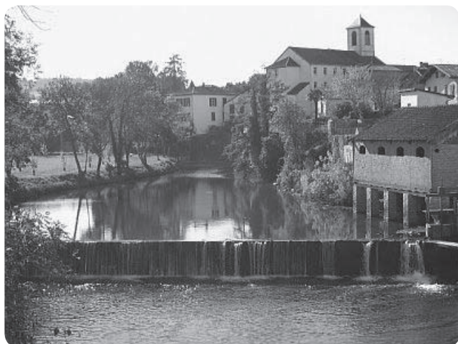
Donapaleu, Amikuzeko herri nagusia

triste prêté à l'UMP. Idée immédiatement soutenue par le maire UMP de Baigorri et le président de la communauté de communes UMP d'Iholdi-Oztibarre, le tout en l'absence du président de la CC de Baigorri-Garazi, qui n'est pas UMP, et qui n'est bizarrement pas invité à cette commission ! On voudrait faire de ce projet une manœuvre politique qu'on ne s'y prendrait pas autrement ! Or, dans votre article, c'est bien ce président de CC non invité qui est qualifié de « notable » pressant le gouvernement !!