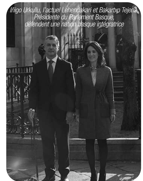
Iñigo Urkullu, l'actuel Lehendakari et Bakartxo Tejeria, Présidente du Parlement Basque, défendent une nation basque intégratrice