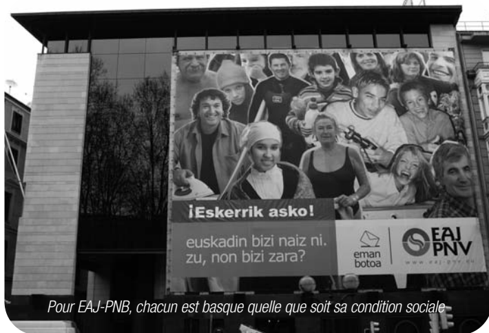
Pour EAJ-PNB, chacun est basque quelle que soit sa condition sociale

Pour EAJ-PNB, la nature fédérale de la nation basque la projette naturellement comme une nation parmi d'autres dans l'Europe fédérale. La Gauche Abertzale, dans sa vision altermondialiste et internationaliste de gauche situe la nation basque parmi les nations solidaires du Tiers-Monde. La dimension européenne n'est pas fondamentale. Ainsi, la gauche Abertzale s'est prononcé historiquement contre le Traité de Maastricht ou le Traité Constitutionnel Européen, alors qu'EAJ-PNB avant soutenu ces deux Traités.