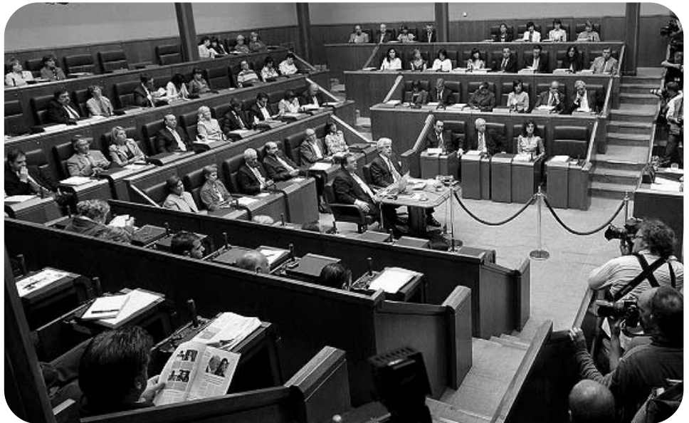
Le Parlement Basque réunit toutes les sensibilités du Pays.

Bilbao créé en 1899 et qui dépasse dès sa création 1100 membres alors que la première société nationaliste Euskeldun Batzokija, créée en 1895, avait durant les deux années de son existence, des effectifs réduits la plupart du temps à moins d'une centaine de membres.