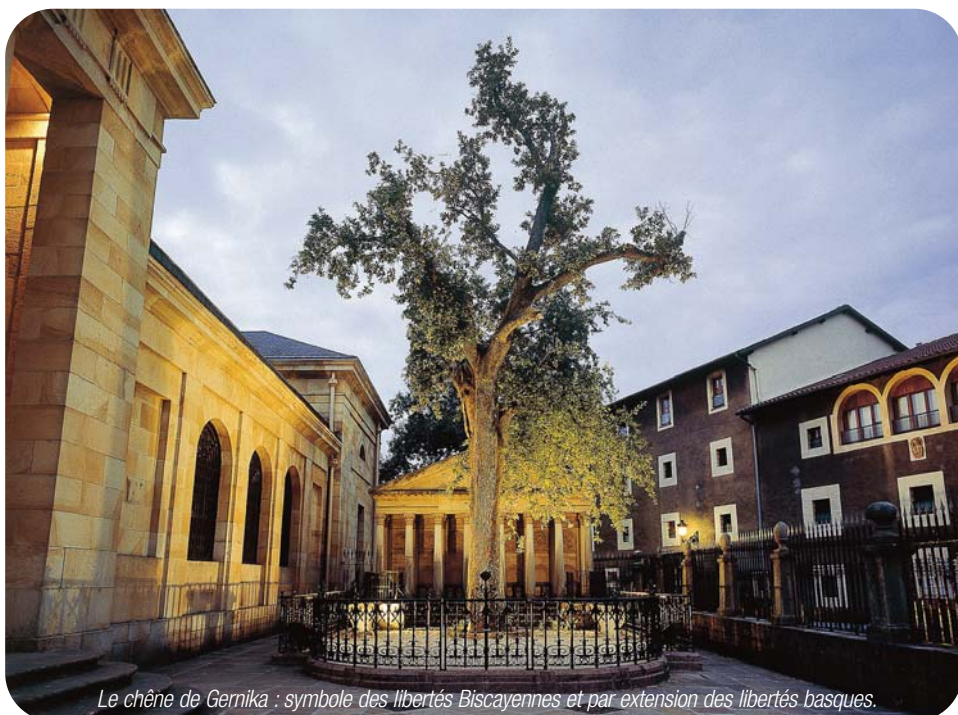
Le chêne de Gernika : symbole des libertés Biscayennes et par extension des libertés basques.

Le premier livre de Sabino Arana Goiri s'intitule même : « Viscaya por su independencia », « la Biscaye pour son indépendance ». La récupération