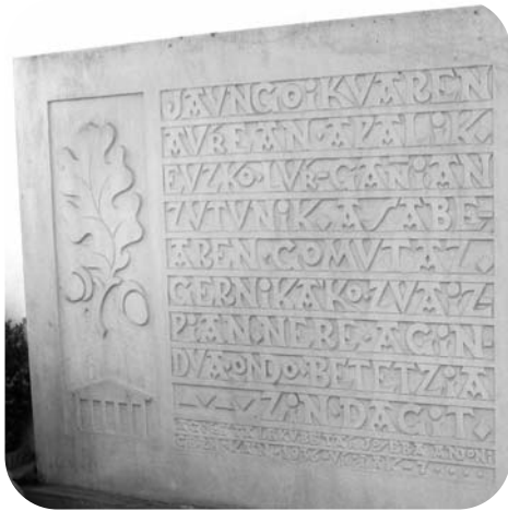
Pierre tombale de Lehendakari Agirre, avec le serment prononcé lors de son investiture