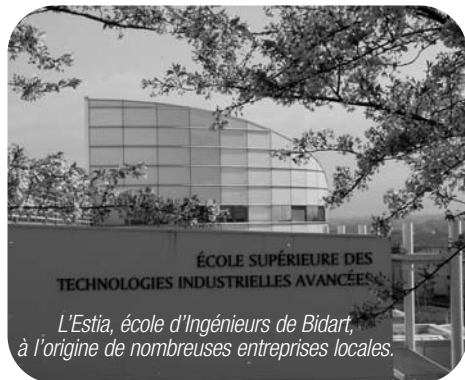
ÉCOLE SUPÉRIEURE DES TECHNOLOGIES INDUSTRIELLES AVANCÉES L'Estia, école d'Ingénieurs de Bidart, à l'origine de nombreuses entreprises locales.

Lorsque Charles Pasqua, à la tête du Conseil général des Hauts de Seine créa une université privée, ou que Renée Monory, président du conseil général de la Vienne, impulsa, seul, le Futuroscope, personne ne pensait que de tels projets, si peu conformes aux compétences départementales, pourraient sortir de terre... et être aujourd'hui cités en exem-