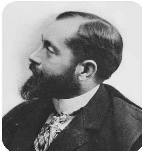
Sabino Arana Goiri

saient jour dans la société de son époque et enfin pour perfectionner les formes lexicales autochtones.