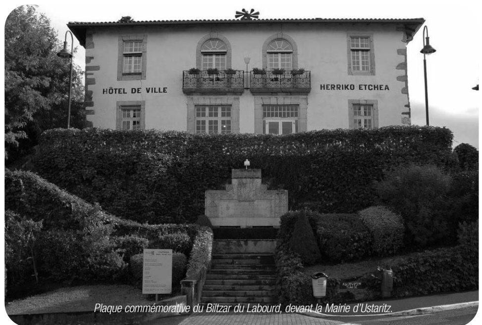
Plaque commémorative du Biltzar du Labourd, devant la Mairie d'Ustaritz.

Le Biltzar du Labourd envoya ses représentants à Paris avec les célèbres frères Garat. Dans les cahiers de doléances, les Labourdins affirmaient ne pas vouloir changer d'institutions, fait unique !