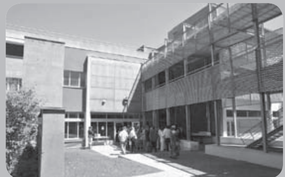
Le site de Montauray à Anglet