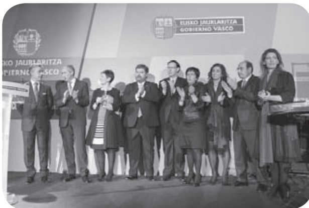
Le Gouvernement Basque a réussi à faire adopter son budget 2014