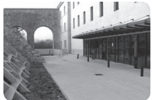
La Faculté pluridisciplinaire à la Nive

Documentation et de Recherches Européennes ; Labayle, Massias) et le laboratoire IKER (Etxepare, Oyharçabal, Videgain, Arkotxa) de littérature et de langue basque (UMR associant le CNRS, l'UPPA et l'Université Michel de Montaigne – Bordeaux 3) ont leur siège à Bayonne. Tous deux sont excellentement appréciés par les organes d'évaluation de la recherche. L'ESTIA est une structure d'accueil accueillant un cinquantaine de chercheurs (technologie, sciences humaines et sociales), mais tous ont leur appartenance scientifique dans d'autres centres (Bordeaux, UPPA et quelques autres). Il est possible, dans les trois cas, de réaliser des études doctorales, mais dans tous les cas, le doctorant doit être rattaché aux Ecoles Doctorales des diverses universités citées (dont le centre n'est pas au Pays basque).