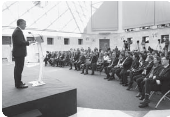
Le plan de paix, un des projets majeurs du Lehendakari Urkullu

Un critère : le plan de paix est basé sur un critère éthique : « dans le récit critique et partagé sur le passé, aucun argument, - ni un contexte de conflit, ni une thèse sur des bandes en affrontement, ni la dénonciation de violation des droits