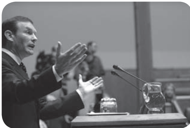
Le lehendakari J.J. Ibarretxe défendait avec ténacité ses projets politiques

La clé de ces réalisations est due à un refus. Celui d'accepter que l'économie mondiale annule le local. Nous avons choisi une autre option, celle d'un paradigme différent basé sur le partage des connaissances et une production hautement spécialisée.