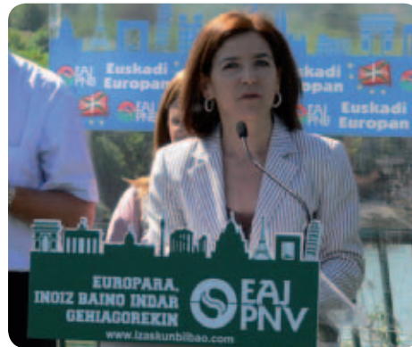
Izaskun Bilbao, l'euro députée d'EAJ PNB lors de la campagne de 2009

de Lisbonne a récemment consacré la procédure de codécision comme principal mode de décision et étendu son champ de compétences à 45 nouveaux domaines législatifs (dont la Politique Agricole Commune ou les