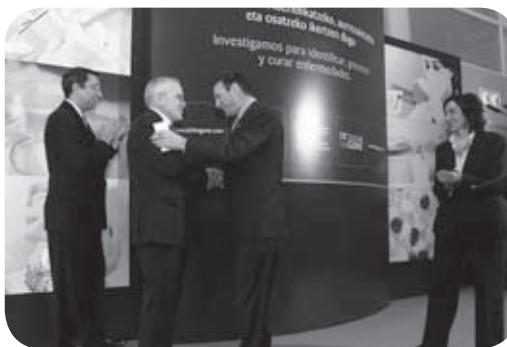
J.J. Ibarretxe promoteur de l'innovation, salue les responsables du CIC Biogune Centre de recherche dans la biotechnologie

d'auto-gouvernement ont contribué à concevoir et à mettre en œuvre un modèle de développement humain durable fondé sur une croissance économique à base élargie et sur le progrès social.