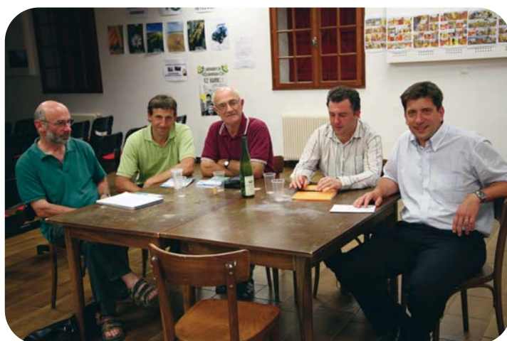
Rencontre entre Euskal Herriko Laborantza Ganbara et la liste Euskadi European

issue. J'ai été marqué par la pertinence (ou l'impertinence) de son journaliste Gilles Choury sur les sujets politiques, qui m'a poussé dans mes retranchements. Cette interview est un tournant dans ma campagne. Elle a permis de m'étalonner, c'est à dire, évaluer ma capacité à convaincre, à souligner les erreurs à gommer; ce fut un exercice très