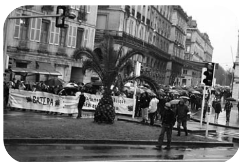
Manifestation pour BATERA

Un processus qui, initialement, est toujours regardé avec méfiance et doit subir l'acharnement judiciaire des autorités de l'État, avant d'être socialement puis politiquement accepté, reconnu, cité en exemple, parfois modélisé, puis appliqué, répété, décliné, ailleurs sur d'autres territoires. Le Pays Basque est déjà un laboratoire institutionnel depuis longtemps.