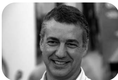
Iñigo Urkullu, Président de l'EBB

Le temps dira si la confrontation entre PSE-EE et EAJ-PNB lors du premier mois de mandat du nouveau gouvernement basque connaîtra une suite analogue ou une période de coopération.