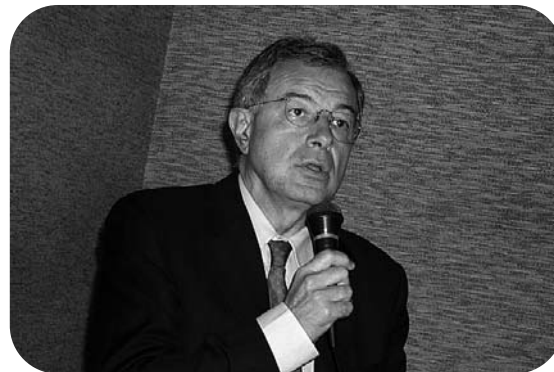
Alain Lamassoure, député au Parlement Européen.