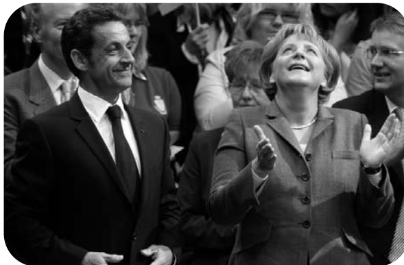
Nicolas Sarkozy et Angela Merkel

Ces résultats sont, malgré tout, à relativiser : l'abstention record reste le fait marquant du scrutin. Le désintérêt pour les élections européennes ne cesse de croître depuis 1979, date de la première élection au suffrage universel du Parlement européen... phénomène d'autant plus inquiétant et paradoxal que l'Assemblée de Strasbourg ne fait que renforcer son influence et joue un rôle majeur dans nombre de domaines qui conditionnent la vie des citoyens.