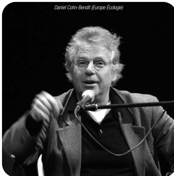
Daniel Cohn-Bendit (Europe Écologie)

Écologie à un vote sanction contre le PS serait réducteur. La famille écologiste sera-t-elle capable de transformer ce rassemblement en un véritable mouvement politique ? Les prochains mois le montreront. Régions et Peuples Solidaires, la fédération de mouvements abertzale intégrera-t-elle cette nouvelle dynamique ?